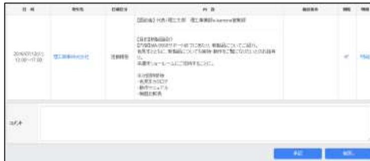
《営業日報承認画面》